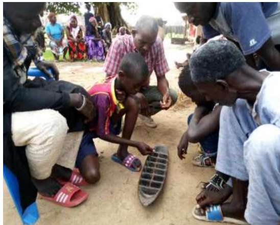
Les enfants jouent au worri