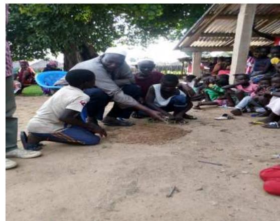
Jeu traditionnel cokki

C'est une bonne idée le fait d'avoir initié des activités de vacances. Ces activités permettent aux enfants d'avoir des connaissances sur leur culture et sur les pratiques traditionnelles. Nous venons de parler du processus de réalisation du « Mondé », ainsi que son utilité. Maintenant, ils savent pourquoi on fait le « Mondé » et comment on le fait. C'est important.