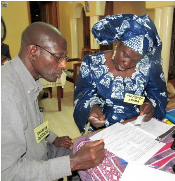
Travaux de groupe