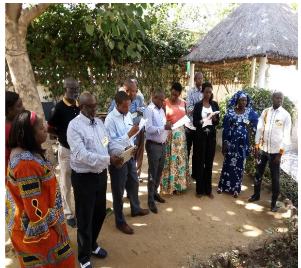
Restitutions des travaux de groupes