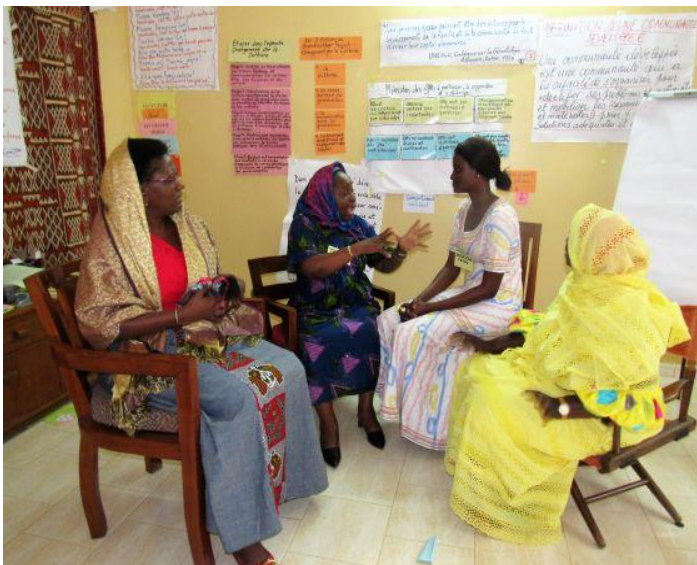
Jeu de rôle