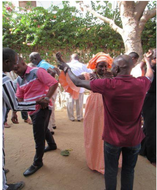
Jeu de modelage